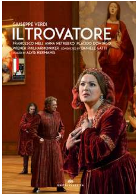
Anna Netrebko, Francesco Meli, Placido Domingo Wiener Philharmoniker, Daniele Gatti, direttore Alvis Hermanis, regia Produzione del Festival di Salisburgo